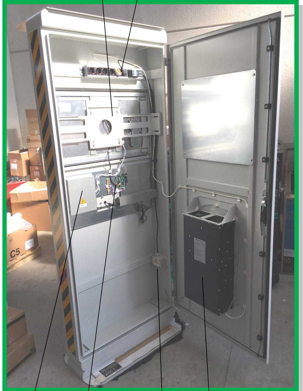
Multipresa a 6 prese con magnetotermico 16 A